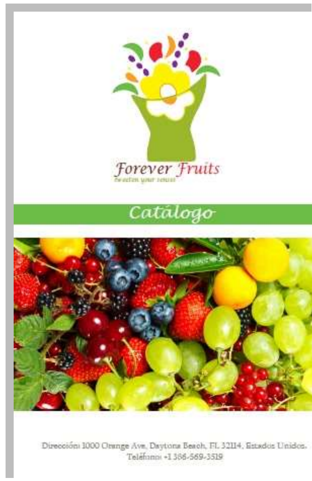
A.5 Portada Catálogo