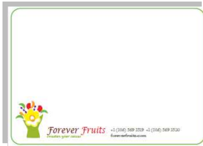
A.3 Tarjeta Entrega