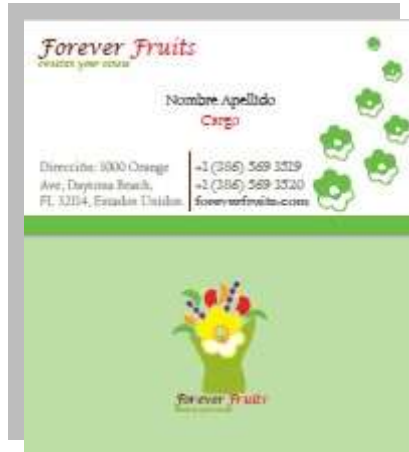
A.2 Tarjeta Presentación y reverso